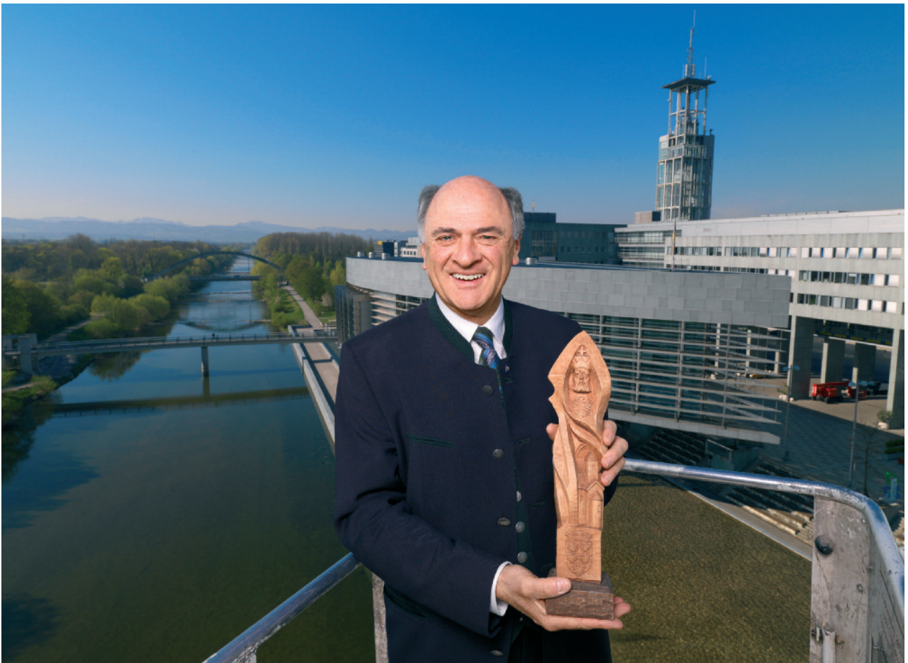
landmark NÖ Landhaus talkinghead LH Dr. Erwin Pröll