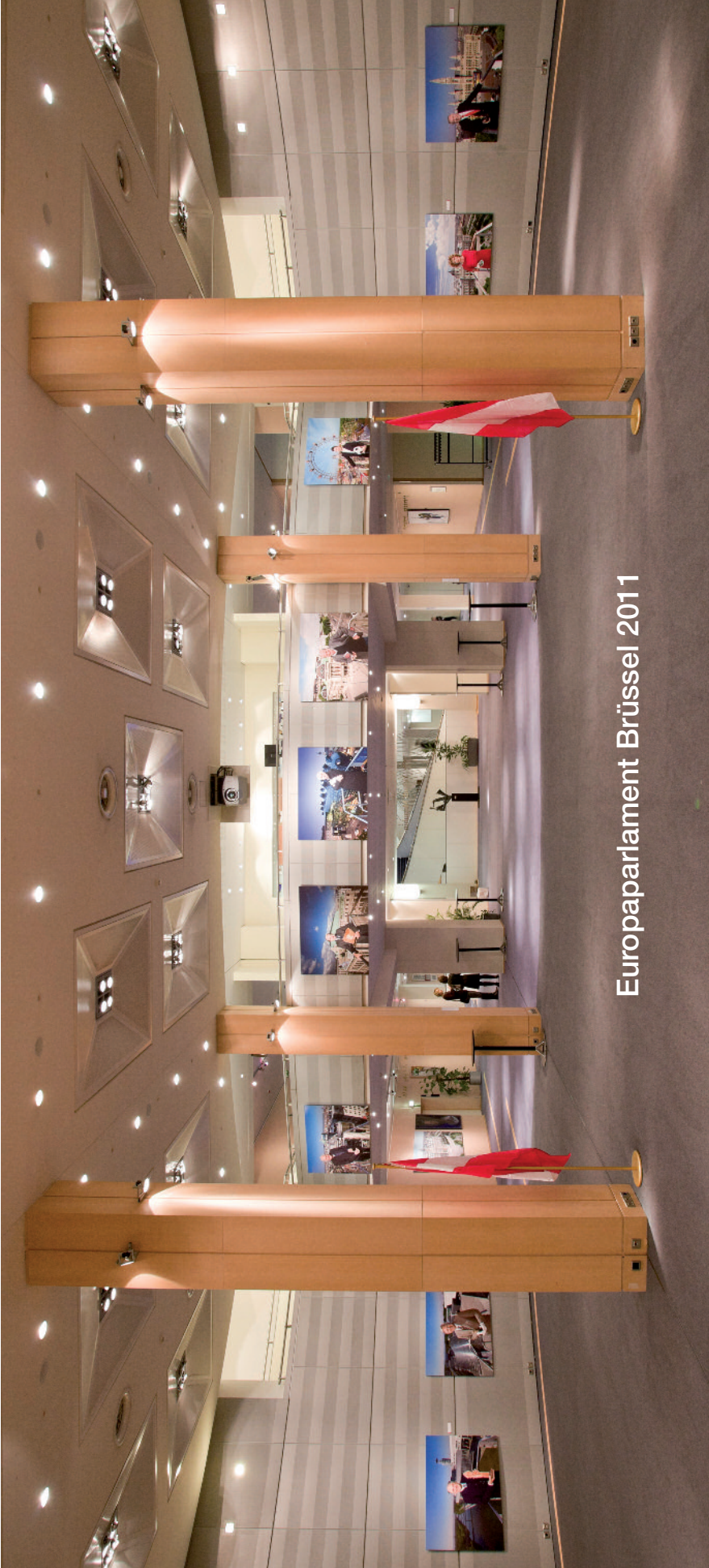
Europaparlament Brüssel 2011