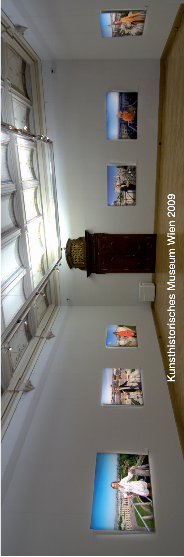
Kunsthistorisches Museum Wien 2009