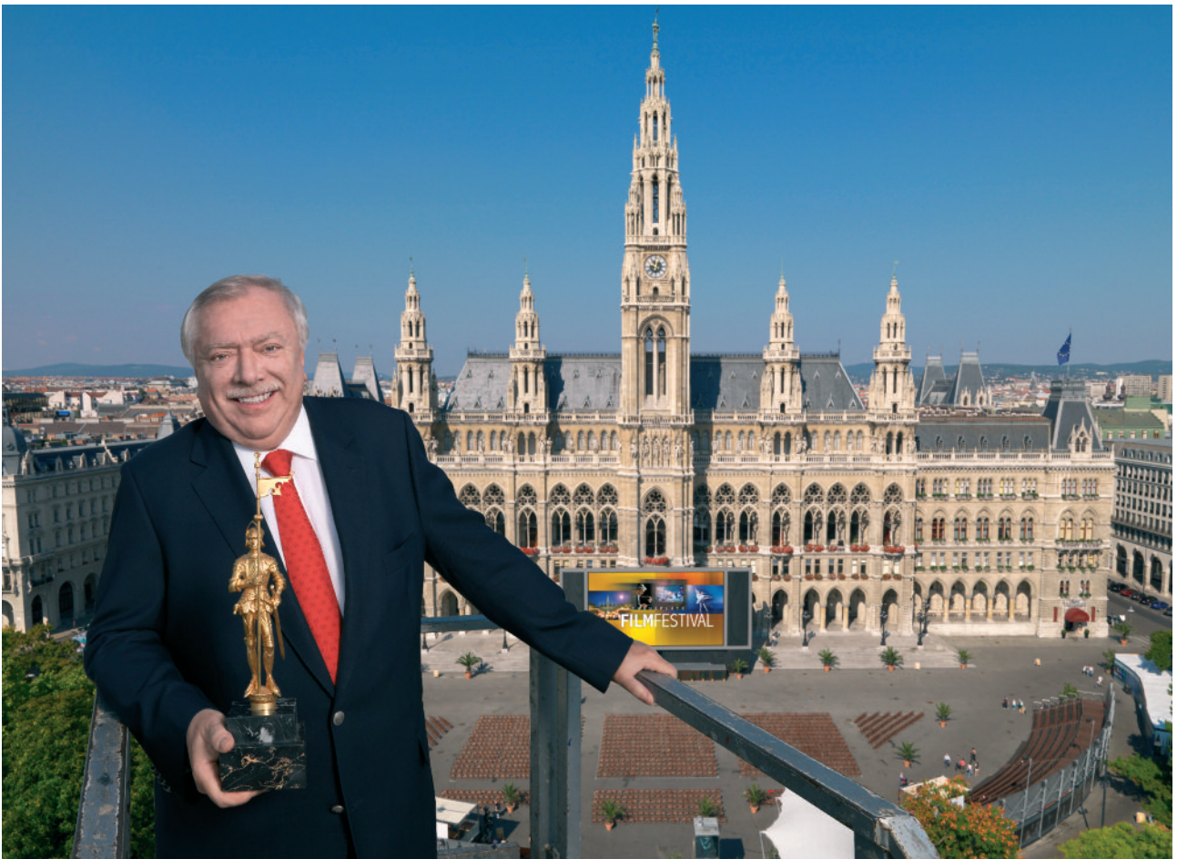
landmark Wiener Rathaus talkinghead Bürgermeister Dr. Michael Häupl