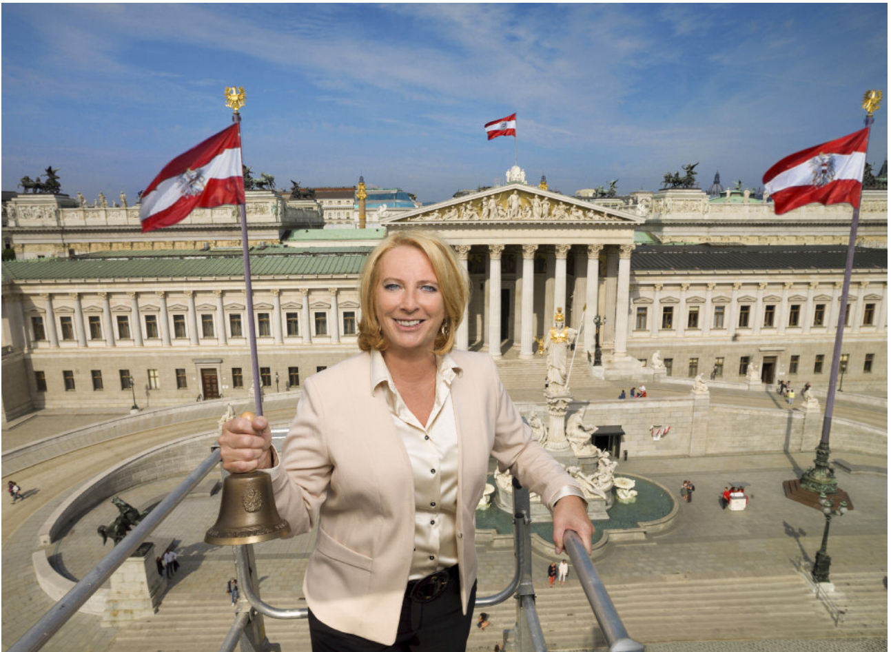
landmark Parlament Wien talkinghead Präsidentin des Nationalrates Doris Bures